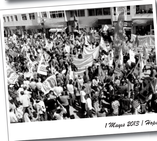
1 Mayıs 2013 | Hopa

bir cevap oldu. 1 Mayıs, büyük kentlerin dışında, Kürdistan bölgesinde ve birçok ilde alanlara çıkılarak kutlandı.