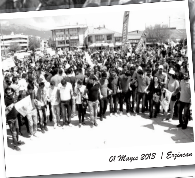
01 Mayıs 2013 | Erzincan