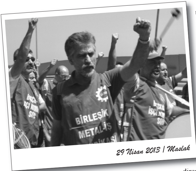
29 Nisan 2013 | Maslak

Maslak'taki Bosch Genel Müdürlüğü önünde devam eden direnişe, 29 Nisan'da Bursa'dan Bosch işçileri dayanışma ziyareti düzenledi. Ziyaretçiler Maslak Sanayi içinde eylem gerçekleştirdiler. Maslak Fakülte Durağı'nda pankartlarını açarak Bursa'dan gelenleri karşılayan Bosch direnişçileri birlikte çalıştıkları mesai arkadaşlarıyla hasret giderdiler.