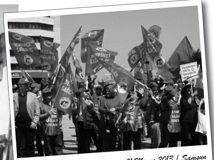
01 Mayıs 2013 | Samsun