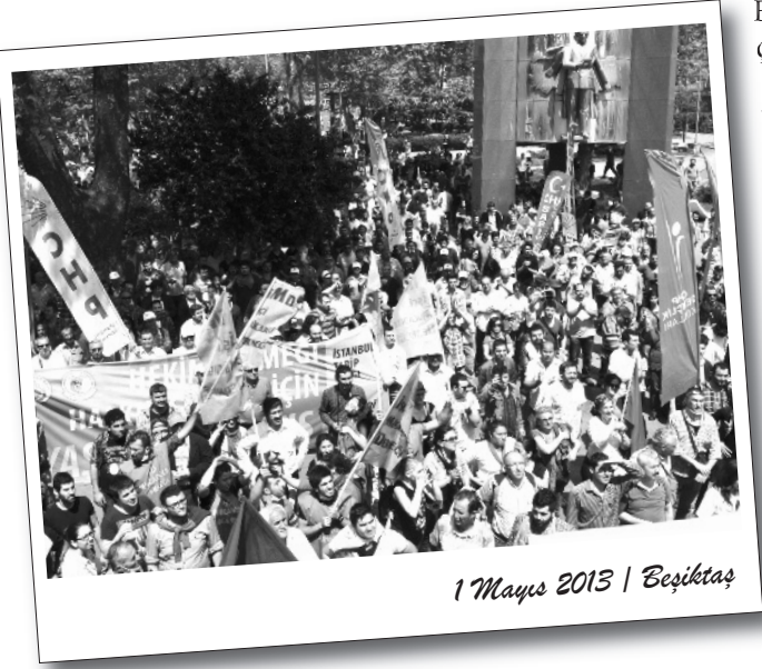
1 Mayıs 2013 | Beşiktaş

“Saldırıların şiddetlendireceğini” söyleyen polis, basın da çekilmesini istedi.