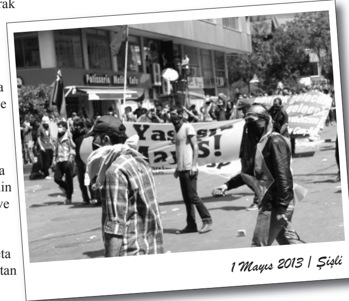
1 Mayıs 2013 | Şişli