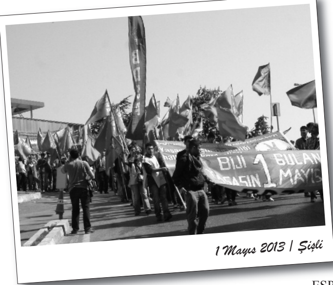
1 Mayıs 2013 | Şişli

Sermaye devleti tarafından “şantiye var” bahanesiyle Taksim Meydanı’nın keyfi biçimde yasaklanmasına rağmen işçi ve emekçilerin Taksim iradesi bu yılki İstanbul 1 Mayısı’nda öne çıktı.